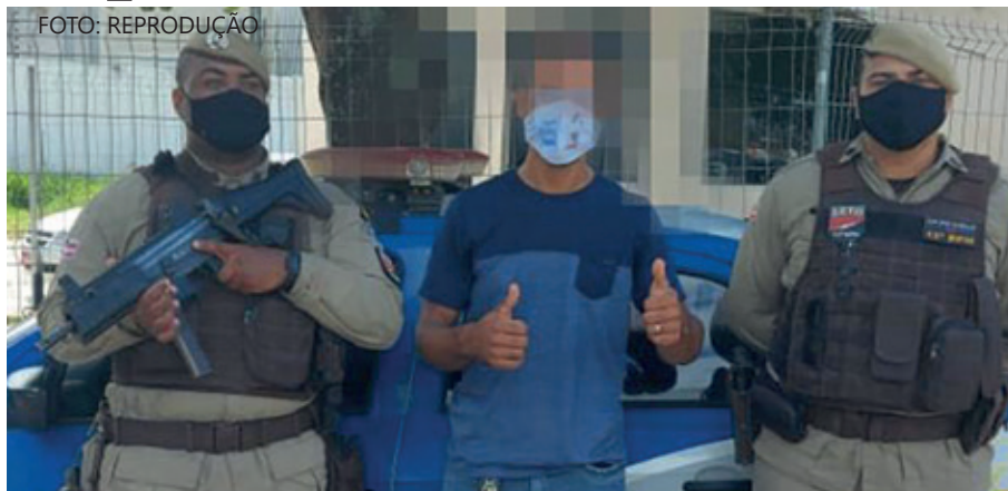
Pai da criança contou com o apoio da PM

Uma guarnição do 12 BPM realizava rondas pela Avenida Concêntrica quando foi solicitada por um homem pedindo ajuda