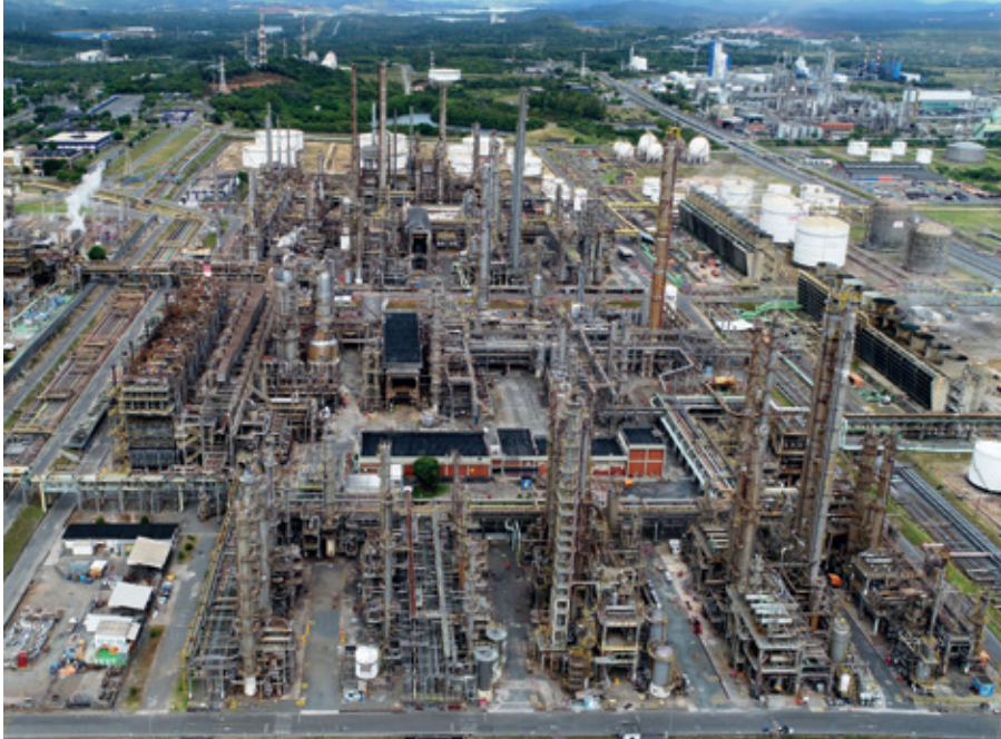
Modelo tem potencial para ser replicado