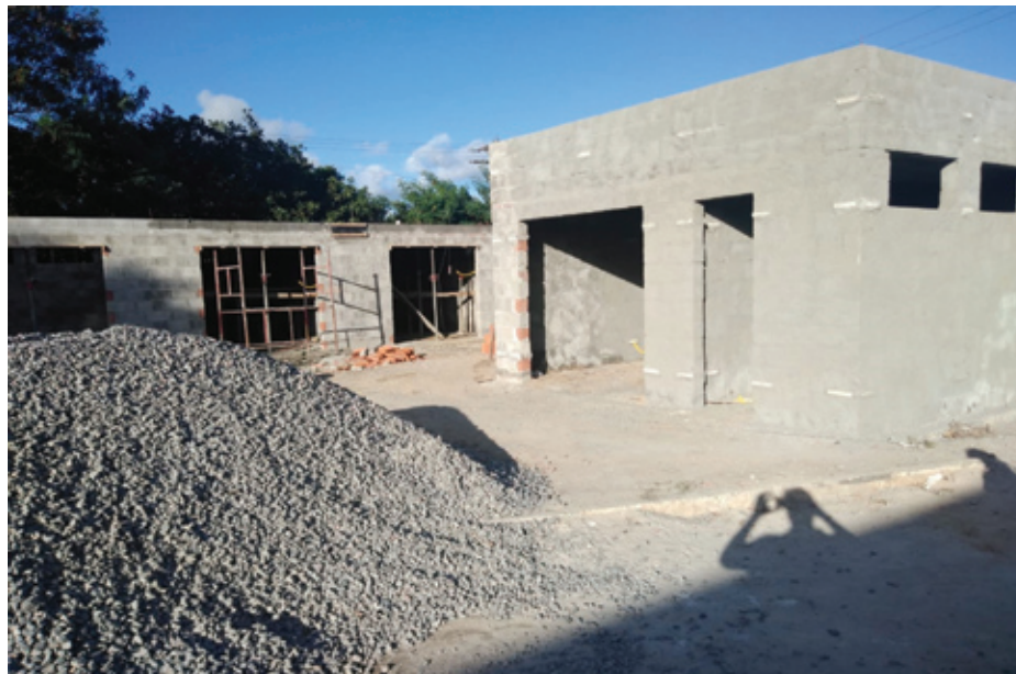
Maternidade Regional de Camaçari vai realizar cerca de 6 mil partos por ano

Com investimento de R$ 50 milhões entre obras e equipamento, a Materni-