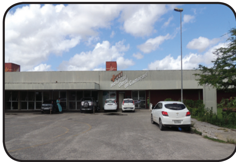
Famílias reclamam de negligência após mortes no HGC Pag 05