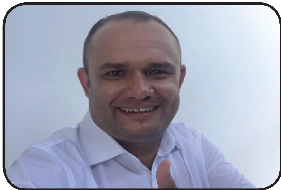
Padrasto de Eva Luana é condenado a 35 anos de prisão Pag 08