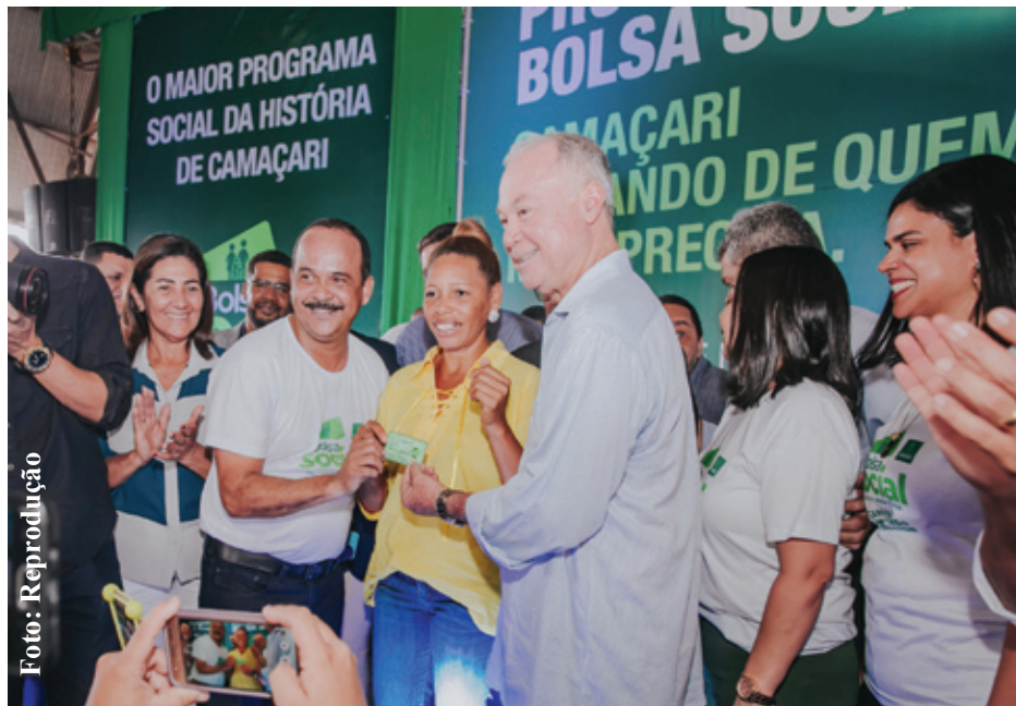
Entrega dos primeiros mil cartões aconteceu no dia 31 de julho